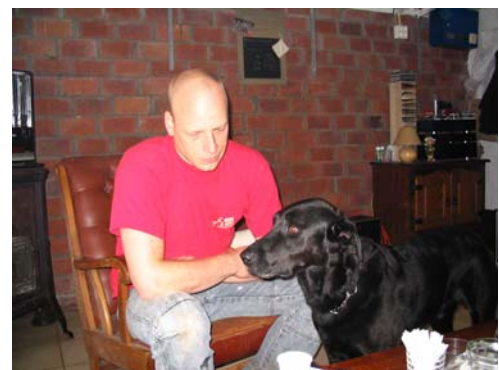
Jeroen en Buddy

Derrie (kruising Podenco), Buddy (kruising Labrador Retriever/ Rottweiler), Moos (Labradoodle), Molly (kruising Chow Chow) en Cirkel (kruising Golden Retriever/ Pyrenese Berghond)