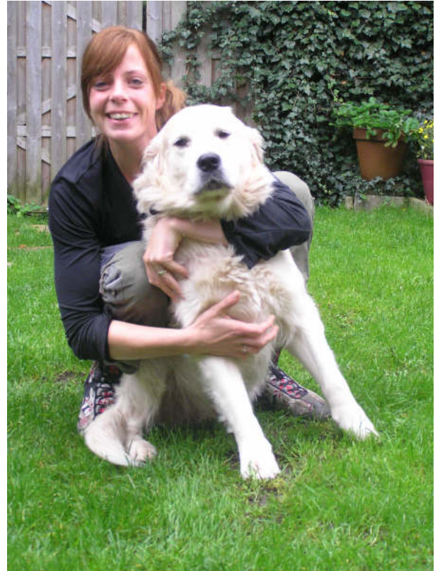
Anne en Cirkel