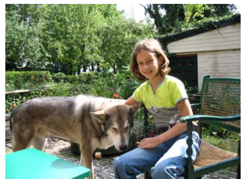
Yack en Sterre